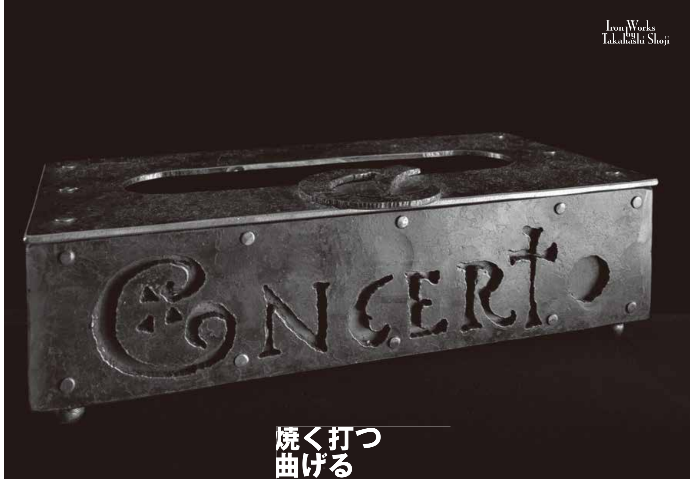
◎ ティッシュボックス