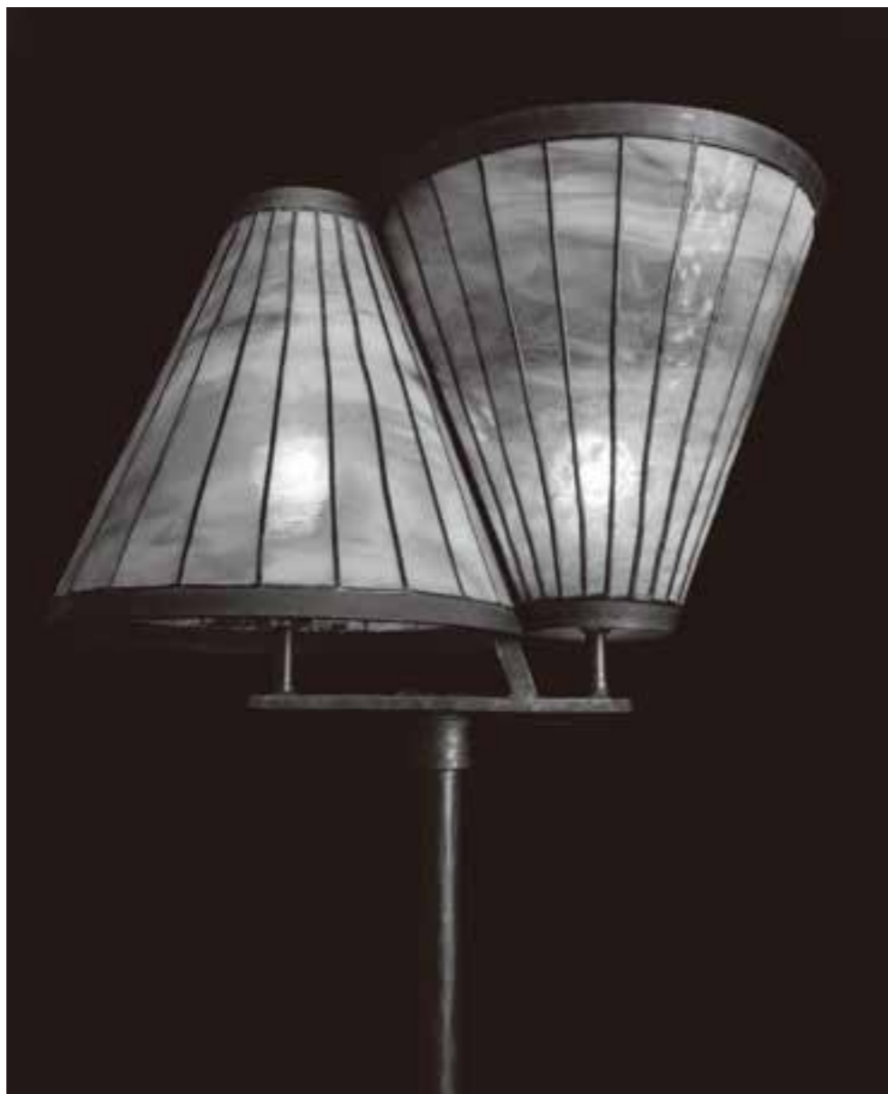
● フロアスタンド[部分]