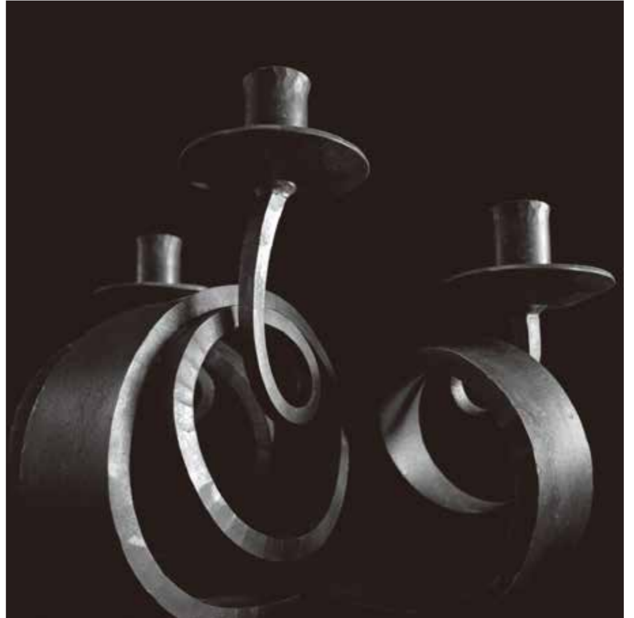
● キャンドルスタンド